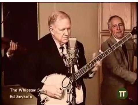
เอ็ด ซีโคตา (Ed Seykota)

“เสี่ยงไม่เกิดการขาดทุนที่รับได้ แต่ก็มากพอที่จะเห็นน้ำเห็นเนื้อ ในยามที่กำไร หาไม่แล้วจงอยู่เฉยๆ”